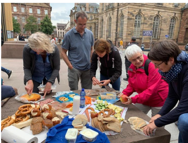
Abbildung 7 IMG Zubereitung Picknick Bildunterschrift "Alle etwas mitbringen"

Zusammen ist Vieles einfacher. Nach dem Gottesdienst machten wir ein Picknick vor dem Straßburger Münster. Eigentlich war nicht mehr viel da, nur noch Reste von gestern. Es war Sonntag. Geschäfte zu. „Wer hat noch etwas dabei?“, war die Frage. „Bitte lege es in die Mitte.“ Am Anfang war es ganz wenig. Doch dann brachte jemand eine Gurke, jemand anders 4 Äpfel, noch ein wenig Käse in einer Box, eine halbe Packung Kekse und so weiter und so weiter.