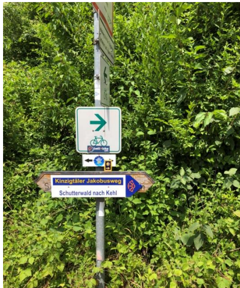
Abbildung 1 IMG Kinzigtaler Jakobsweg "Der Jakobsweg führt auch durch das Kinzigtal"