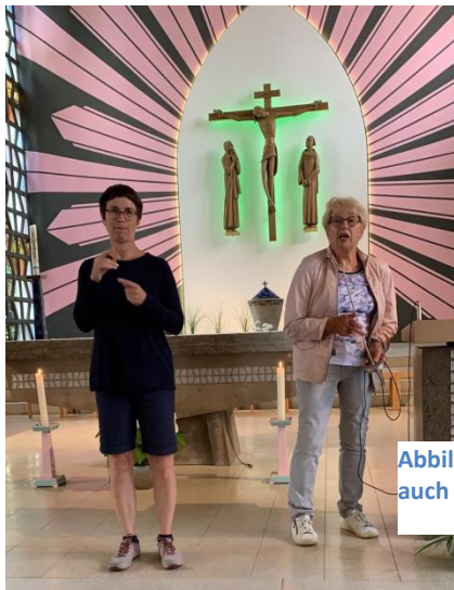
Abbildung 3 IMG Gaa und Schäfer Goldscheuer Bildunterschrift „Kirche in Goldscheuer“

Pilgerwanderung auf dem Jakobsweg in der Ortenau 12.-14. Juli