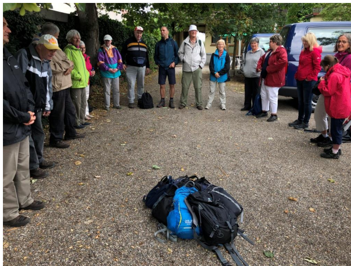
Abbildung 8 IMG Kreis mit Rucksäcken Bildunterschrift "Die bunte Gruppe"

Gemeinsam unterwegs sein – das heißt, sich aufeinander einstellen. Vom eigenen Rhythmus abweichen. Sich fragen: Was brauche ich zum Wohlfühlen? Aber auch schauen, dass es den Mitmenschen gut geht. Gar nicht so einfach. Manche Teilnehmende haben mehr Unterstützung gebraucht, zum Beispiel beim Packen oder Medikamente nehmen. Wenn den einen wichtig war, die Gebärde für „klein“ auf eine bestimmte Art zu gebärden, war es für andere in dem Moment nicht möglich, überhaupt 3 Gebärden hintereinander zu gebärden. Das ging zu schnell, das war zu viel. Auf der anderen Seite: Manche Personen wirkten auf den ersten Blick körperlich eingeschränkt. Und dann wanderten sie den ganzen Weg ohne Jammern, ohne Beschwerden und hatten Spaß.