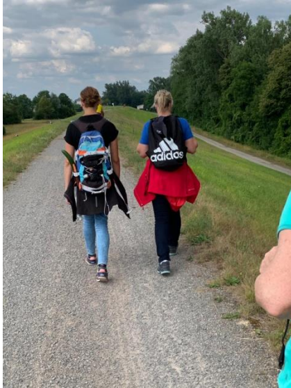
Abbildung 5 IMG Laufen Bildunterschrift „Immer dem Rhein hinterher!“