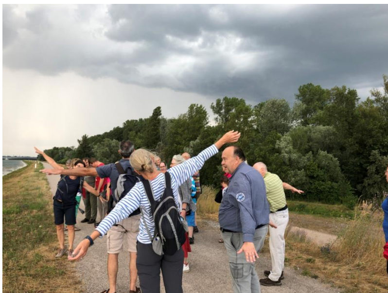
Abbildung 6 IMG Wind am Rhein "Bildunterschrift "Am ersten Abend am Rhein"

Freitagabend: Gerade sind wir angekommen am Hotel in Altenheim. Unser erster Schlafplatz. Es gibt dunkle, schwarze Wolken am Himmel. Doch wir möchten noch gerne zum Wasser. Deswegen verteilen wir uns noch einmal auf die Autos. Mit 28 Personen ist das gar nicht so einfach. Wir fahren ungefähr 5 Kilometer. Erst aus dem Dorf heraus. Einen Feldweg entlang. Dann kommen wir in das Auen-Gebiet. Es gibt viele Laub-Bäume und Wasser. Wir steigen aus an einem Baggersee. Wir laufen ein Stück einen Weg entlang zwischen den Bäumen, über eine Brücke. Dann hört der Wald auf. Vor uns ist ein kleiner Damm. Wir steigen eine Treppe und hoch und plötzlich – ist da das Wasser. Der Rhein. Er ist türkis und blau und grün. Und ein starker Wind ist wie aus dem Nichts auch da. Wir breiten die Arme aus. Wir riechen das Wasser. Nur der Donner schafft es uns zu vertreiben.